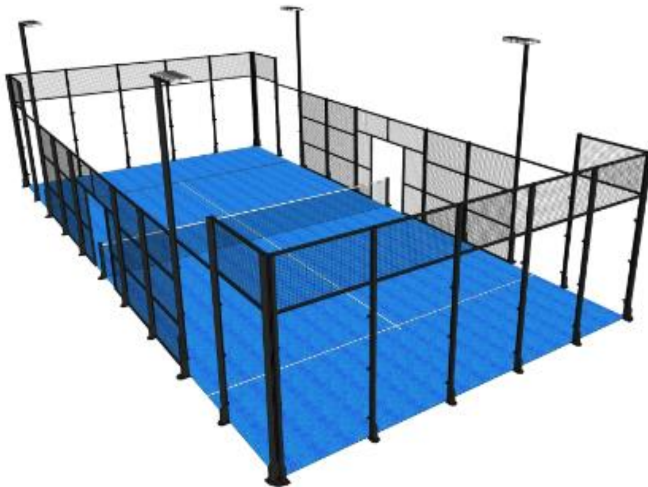
adidas ALUMINUM RF3.0 Ateities lauko padelio kortas.